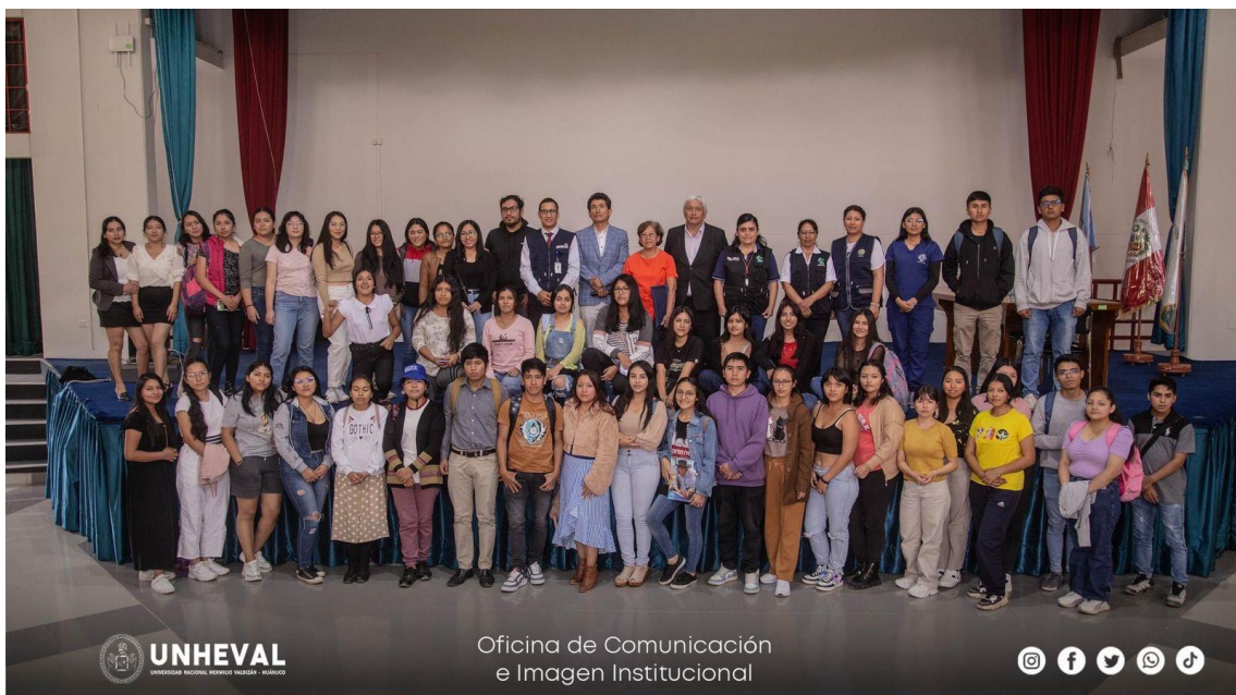
FOTO GRUPAL DE LOS INTEGRANTES DEL VOLUNTARIADO DE LA UNHEVAL 2023