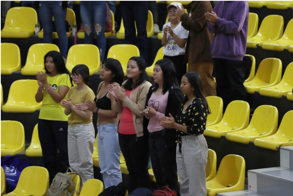
VOLUNTARIOS PARTICIPANDO DE LAS DINÁMICAS