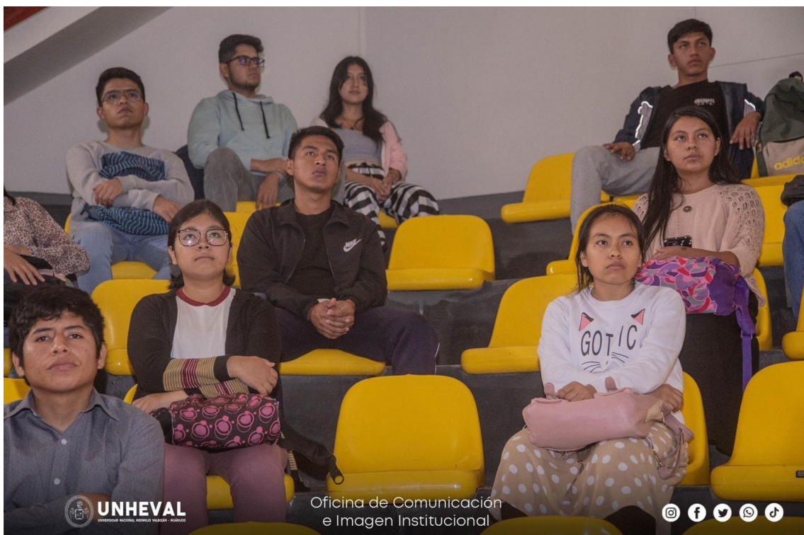
LOS VOLUNTARIOS SIENDO CAPACITADOS PARA INICIAR SUS ACTIVIDADES