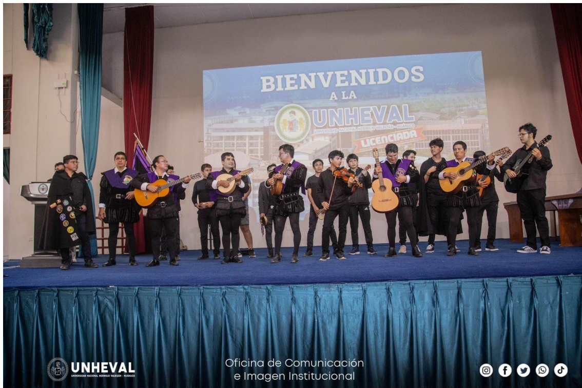
PRESENTACIÓN DE LA TUNA DE LA UNHEVAL