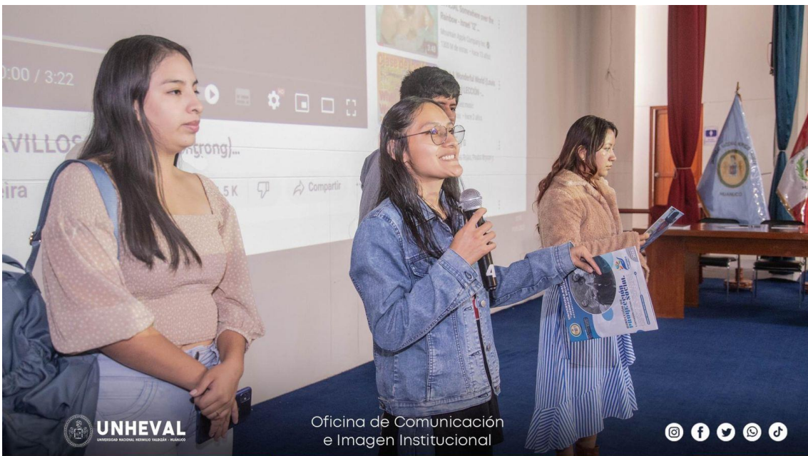
PALABRAS DE LOS MIEMBROS DE LA JUNTA DIRECTIVA DE VOLUNTARIOS 2023