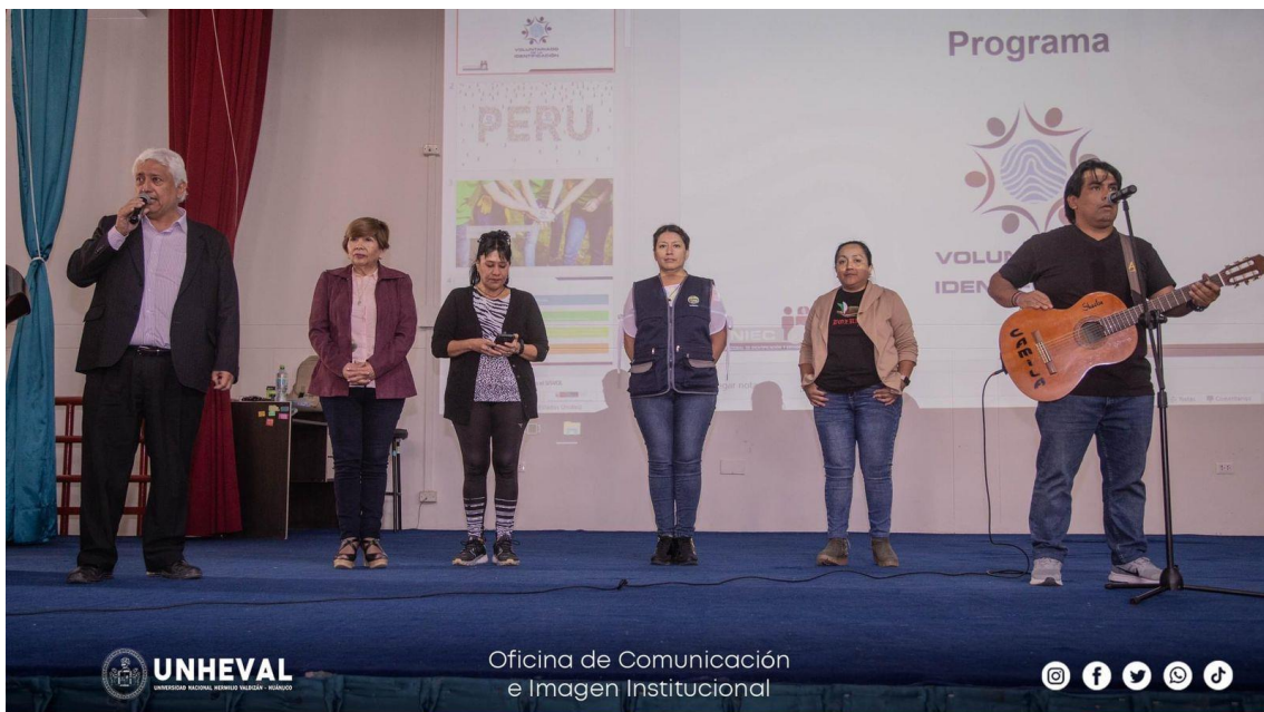
PRESENTACIÓN DE LA PASTORAL DE LA UNHEVAL