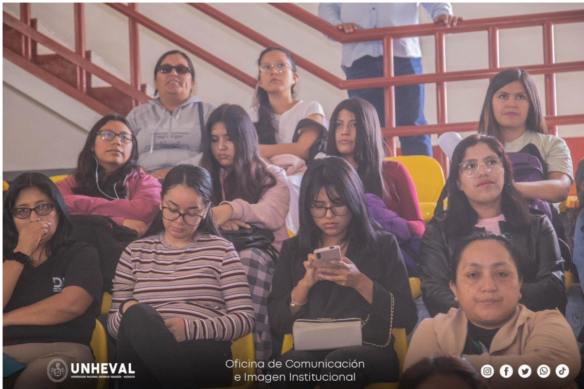
LOS VOLUNTARIOS SIENDO CAPACITADOS PARA INICIAR SUS ACTIVIDADES