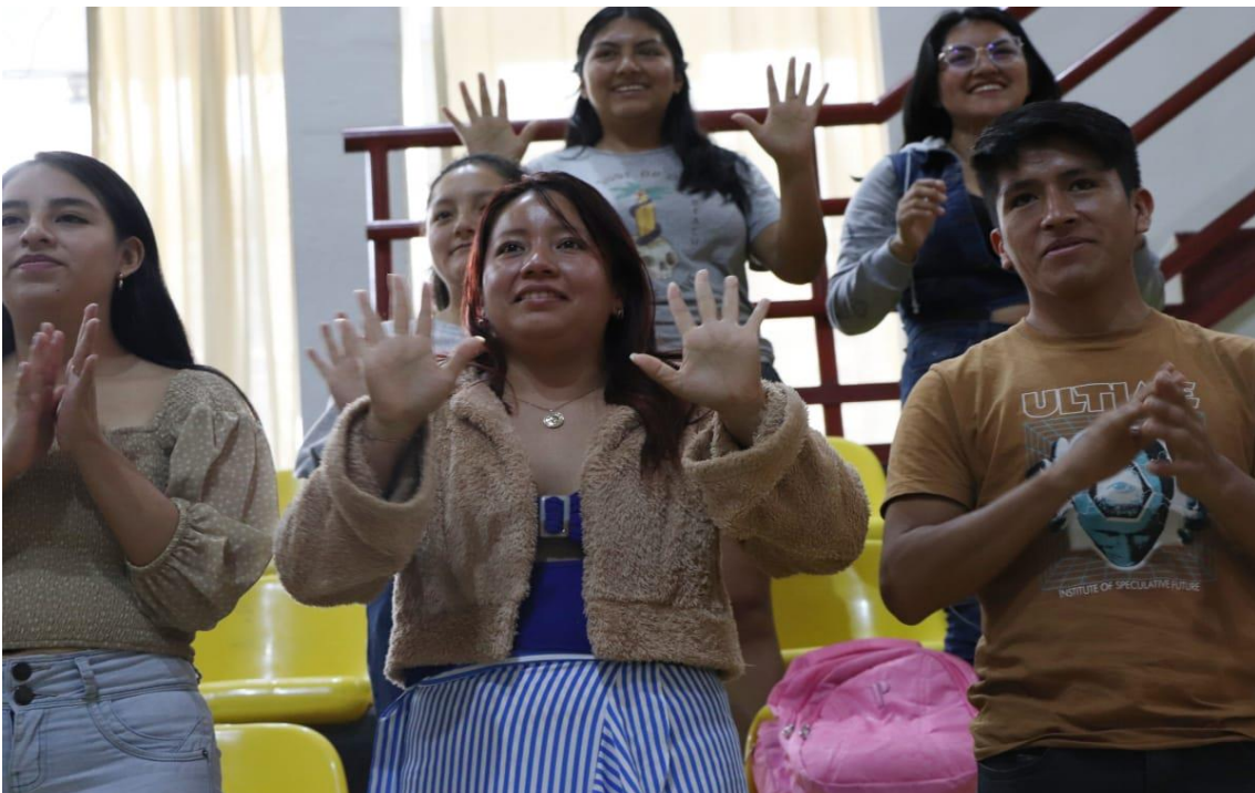
LA PASTORAL PUSO EN ACTIVIDAD A TODOS LOS VOLUNTARIOS CON SUS DINÁMICAS