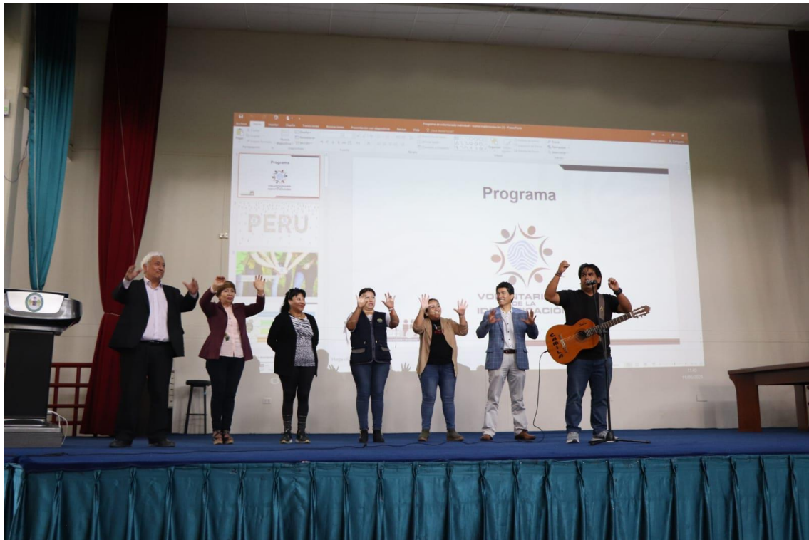
MIEMBROS DE LA PASTORAL PARTICIPANDO DE LAS DINÁMICAS